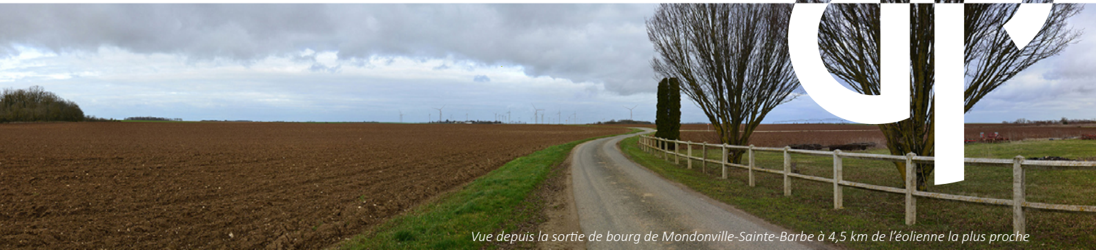
Vue depuis la sortie de bourg de Mondonville-Sainte-Barbe à 4,5 km de l'éolienne la plus proche